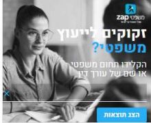
אולי יעניין אותך