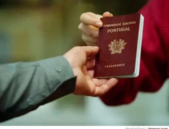
דרכון פורטוגלי

"תוכנית הגולדן וזה משתנת, אך ההזדמנות עדיין קיימת" - עו"ד אדם יודי מנתח את השינויים בתוכניות התושבות האירופיות לשנת 2025