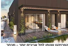
הפריקט שנותן לתל אביבים יותר - מבחר דירות ופנטהאוזים מפנקים יותר