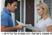
לאשונה בישראל: דוח מפורט על הדיירים - כך תדעו למי אתם משכירים