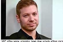
בוגי יעלון תובע את יאיר נתניהו: צייץ עלי "לך לאברבנאל"