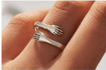
המתנה שגרמה לבת שלי לבכות מרוב התרשות (זה גאוני)