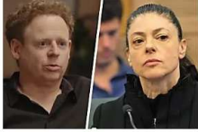
"כעסתי מאד על מרב שלא התאחדה עם מרצ. לא דיברתי איתה בגלל זה"