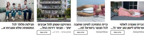
קישורים מקודמים ע"י סאבילה