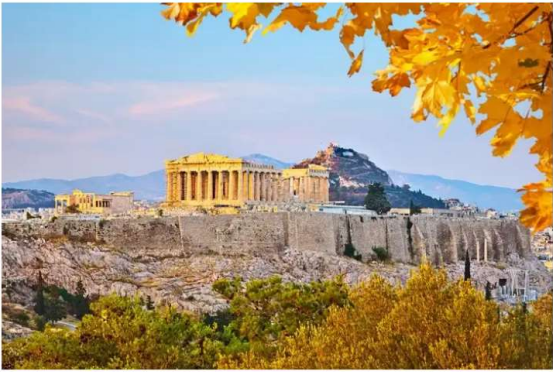
יעד פופולרי נוסף: יוון

המדינה אטרקטיבית במיוחד עבור משקיעים בשינוי תחומים: "הפוקוס הכלכלי בקפריסין הוא על תיירות, כך שהשקעה בגלל מסחרי ולצרכי תיירות מציעה פוטנציאל תשואה גבוה", מסביר ייזי. "בנוסף, בשנים האחרונות, היא הפכה ליעד מבוקש לריקוויזישן עבור משפחות צעירות ופנסיונרים, מה שמגדיל את הביקוש לגלל למגורים".