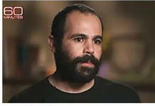
צפיתי בירדן ביבס מתראין וגאלצמי לעצור. כמעט הקאתי מרוב בושה