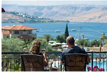
כמו אנם קומו רק בישראל: החל מ-920 אלף ש"ח לזירת יוקרה בכנרת