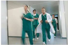
פרפור פרודוזורים אחרי גיל 70? גלו את הפתרון שיחסר לכם המיון