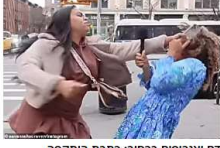
דם ואגרופים ברחוב: תכתב התקפה באכזריות באמצע ריאון