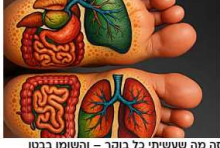
זה מה שעשיתי כל בוקר - והשומן בבטן פשוט נמס!