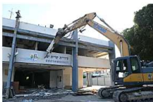
פנית נדלן: קרית ים עברה מהסך ומזמינה אליה משקיעים מכל הארץ