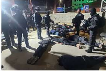
הגיעו לעצור חשוד משפתחו ניסתה למנוע זאת כך זה נגמר