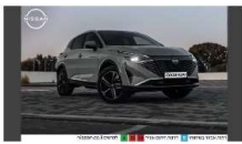
את ההטבה הזו לא תרצו לספס, דלק מתנה לונה