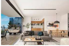
קומפלקס מגורים חדש עם מוסדות חינוך לניל הרך מתחת לבית