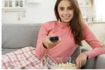
לשפטי את העיניים: אינטרנט סיבים + סלולר נקטו טייב ב-105.9 ש"ח בלבד!