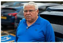
למי מניע חו נכה לרכב ואין מקבלים ללא בירוקרטיה? גלו ב-30 שניות