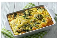
10 דקות הכנה ולתנור: 8 מתכונים מנצחים לפשטידות

למשפחות המעוניינות להשקיע בנדל"ן פיזי, ידיד ממליץ לבחון את יוון. "עם יוון יש לנו ניסיון של שנים, והתוכנית יציבה יחסית".