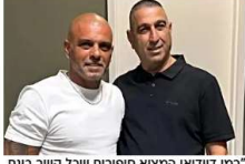
דמי דודיאן המציא סיפורים שכל קשר בינם למציאות מקרה