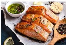
הטעות שרובנו עושים באכילת דג סלמון - שעולה לכם בבריאות