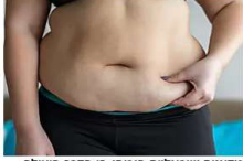
מדענים ישראלים הוכיחו: זו הדרך היעילה ביותר לירידה במשקל