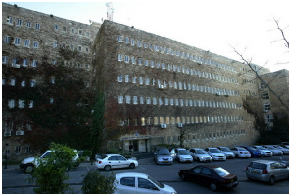
משרד האוצר. "יוצאי קווקז קיבלו תשלום חד פעמי מקרן הסיוע של גרמניה"