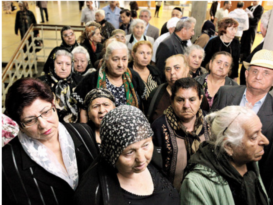
יהודי נאלצ'יק בבית המשפט

אבל גם שייקספיר שאל בזמנו "מה יש בו בשם? גם אם תקרא לוורד בכל שם אחר, הוא עדיין יריח מתוק ונפלא". זה לא תרגום מדויק, ואני לא בטוח שהסיפור על 104 הקווקזים שיוגש כאן, יעשה לכם מתוק בלב או נפלא בנשמה.