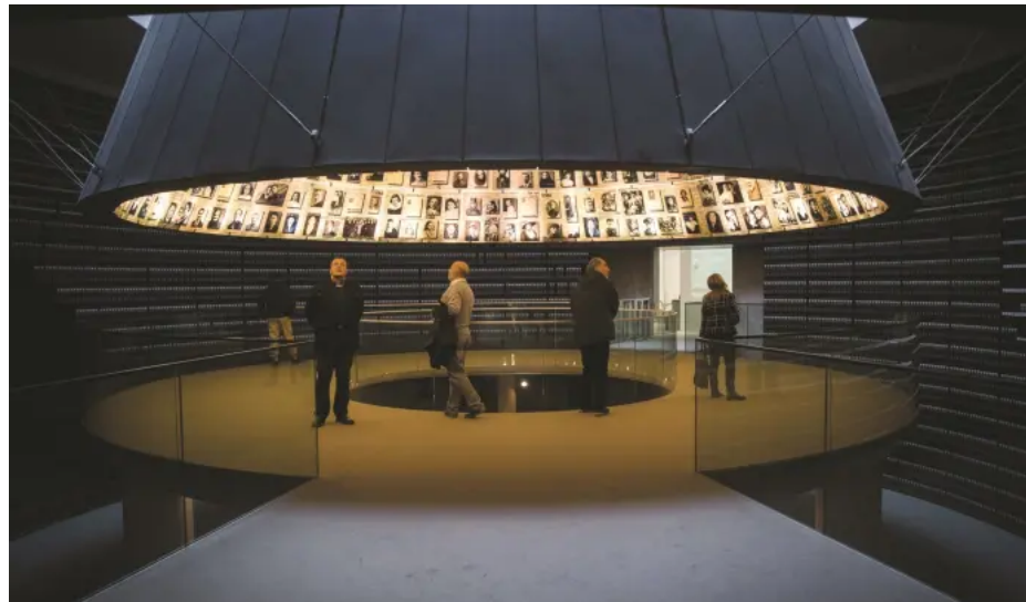
מוזיאון יד ושם

העליון יכיר בזכאותם? בית המשפט העליון ידון בערעור יוצאי מרוקו על אי-הכרתם כניצולי שואה שנפגעו באופן ישיר מהמשטר הנאצי, לאחר שבית המשפט המחוזי בחיפה לא הכיר במאבקם של יוצאי העדה ששהו במרוקו בין אוקטובר 1940 לנובמבר 1942. השאלה המשפטית המורכבת, העומדת לטענת המערערים בליבת בקשת רשות הערעור לבית המשפט העליון, היא זכאותם של אלפי יוצאי מרוקו לתנמולים חודשיים מכוח חוק נכי רדיפות הנאצים.