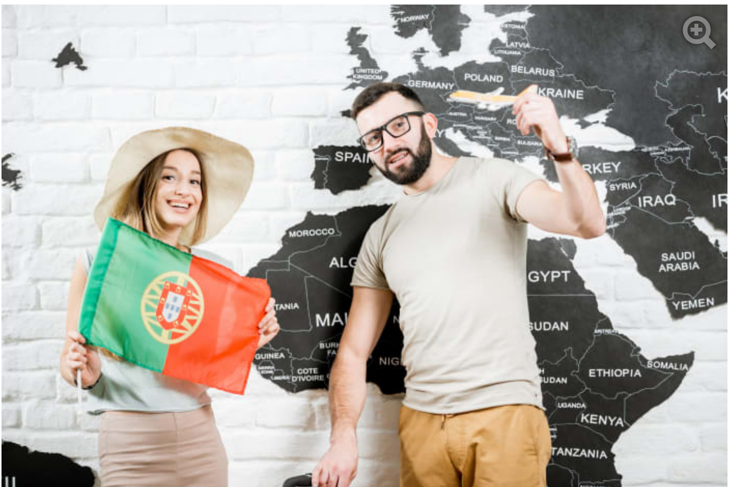
הזדמנות מצוינת להיתר תושבות ואף אזרחות

עו"ד ונטריון אדם ידיד, בשיתוף zap משפטי יום ראשון, 17 בינואר 2021, 10:09