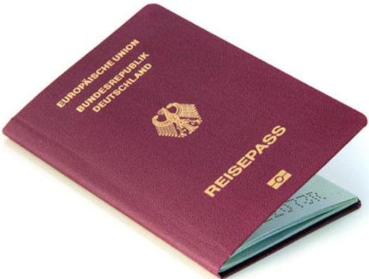
דרכון גרמני (צילום: מערכת וואלה! NEWS, אילוסטרציה)

עו"ד ונוטריון ויאצ'סלב פונומריוב ועו"ד ונוטריון אדם ידיד, בשיתוף zap משפטי יום שני, 05 ביולי 2021, 10:29 עודכן: 10:33