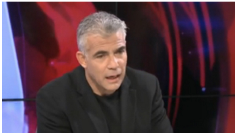
יאיר לפיד, מיוזמי הצעת החוק שנפלה

יו"ר יש עתיד, ח"כ יאיר לפיד, אמר בדיון במליאה: "זה מעשה לא מוסרי לדחות את הדין בחוק הזה. אין כאן מקום לפוליטיקה אין כאן מקום לענייני קואליציה ואופוזיציה. אלה ניצולי שואה שמתים כל יום. אם תדחו את החוק הזה אתם דנים חלק מהם למוות בעוני. תשאלו את עצמכם אם מבחינה ערכית אתם מסוגלים להרים יד ולהצביע נגד ההצעה הזו. יושבים פה אנשים בעלי מצפון שאני מלא הערכה אליהם, אלי אלאולף ידידי, אלי בן דהן, אנשים שמצוקה של יהודים קורבה להם. אתם תצביעו נגד חוק שיאפשר לניצולי שואה לקבל את מה שמגיע להם?"