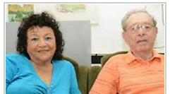
בני הזוג גולדר