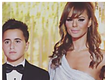
הככ אמא ת שבלתמ רכל