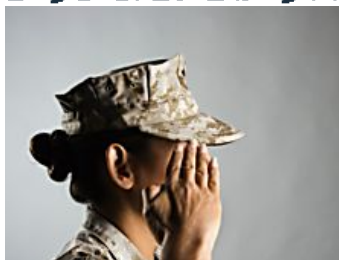
תוניצקה ולפנ בראמל-