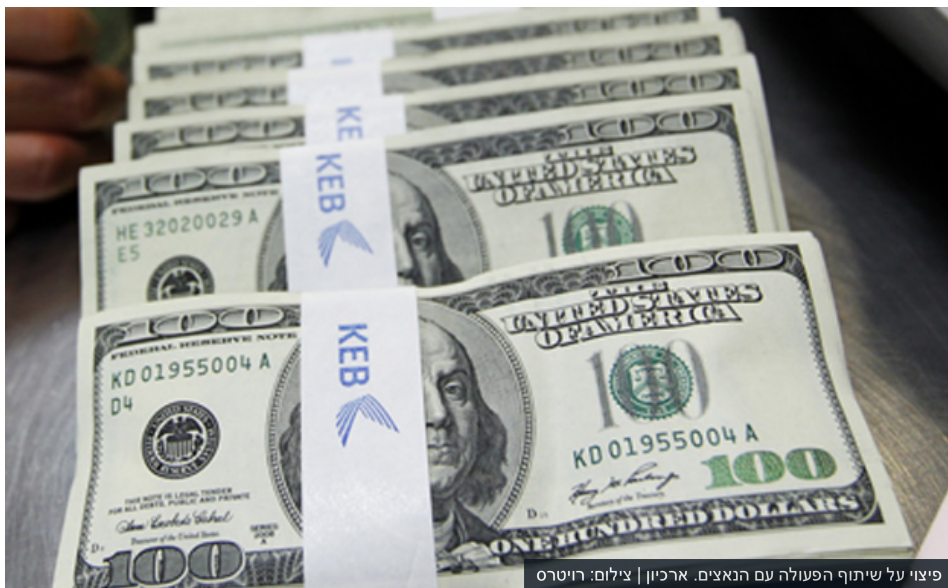
פיצוי על שיתוף הפעולה עם הנאצים.

זו שדר | זו שדר 2 | אפריל 13:40 04/11/15