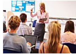
יום לפני מבחן: כך תשפרו את סיכויי ההצלחה (מכלה)