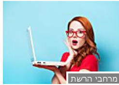
5 דרכים להרוס את קורות החיים שלכם (AllJobs) מרחבי הרשת