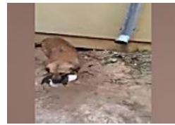
צפו: כלבה מצילה גורים מטביעה במוצב צה"ל (ירוק)