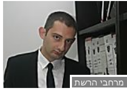
הסדרת מעמדם של ישראלים השוהים בחו"ל מכל סיבה (TheMarker cafe) מרחבי הרשת