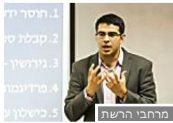
מיהו גורו ההשקעות הישראלי שפועל בשיטתו של וורן (TheMarker LABELS) מרחבי הרשת