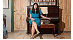
דירה כזאת עוד לא ראתם (Time Out)