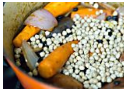
חמין טבעוני: 4 מתכונים מחממים (אזכל)